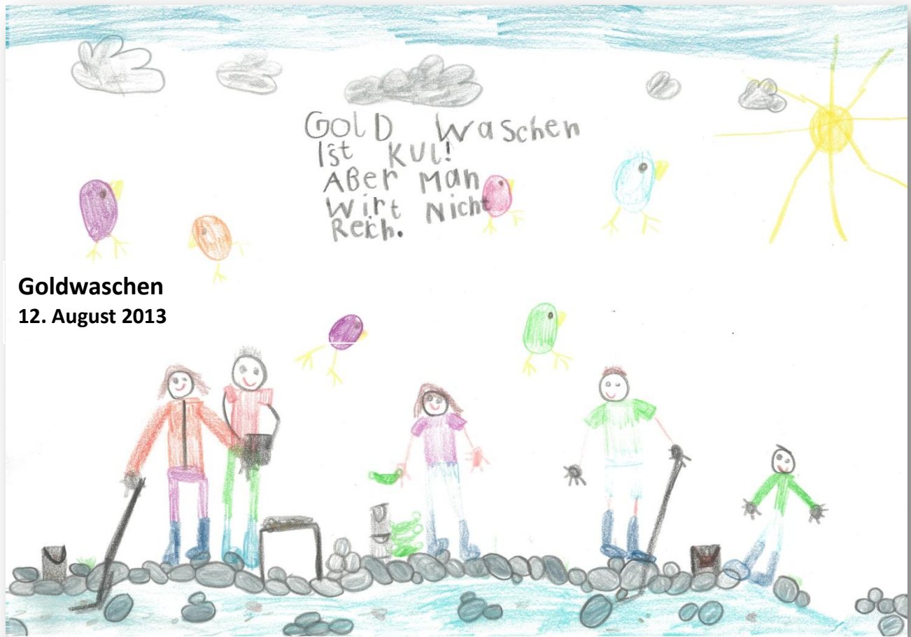
Goldwaschen 12. August 2013