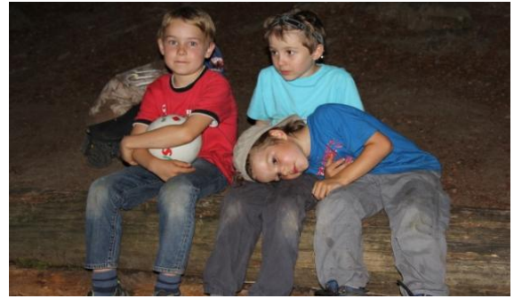
Müde, aber es wird nicht richtig dunkel...

Nur Mut liebe Kinder und liebe Erwachsene. Die nächste Nachtwanderung kommt bestimmt, frühestens aber Ende Sommer 2014, damit die Nacht nicht zulange auf sich warten lässt und die Dunkelheit dem Tag den Garaus macht.