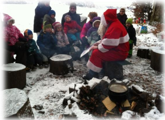
Samichlaus Dez. 2012

Regula: Das sind die Kindergeburtstage mit einem speziellen Ritual, oder wenn wir Popcorn auf dem Feuer spicken lassen, oder die Würstlitage, an dem jedes Kind seinen Cervelat auf dem Feuer brutzeln lässt! Auch die Samichlausfeier ist immer ein grosses Ereignis.