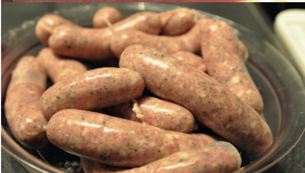
schmackhafte Neukreationen à la Elternverein

Für die eher kreativen Mitglieder wurde ein Kurs „Sandstrahlen für Erwachsene“ organisiert. Auch dieser Kurs konnte aufgrund des Interesses zweimal durchgeführt werden.