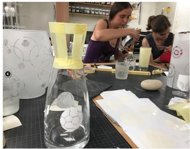
Volle Konzentration beim Sandstrahlen

Für die eher kreativen Mitglieder wurde ein Kurs „Sandstrahlen für Erwachsene“ organisiert. Auch dieser Kurs konnte aufgrund des Interesses zweimal durchgeführt werden.