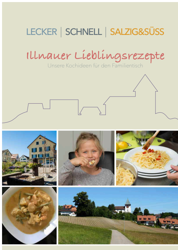
Titelbild unseres Kochbuches zum 25 jährigen Jubiläum