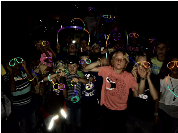
Wir kommen nächstes Jahr ganz sicher wieder! Nachtwanderung 2017

Im September war die Dorfchilbi wiederum das Dorfereignis des Jahres, und die Zeltattraktionen des Elternvereins Illnau sorgten zwei Tage für gute Laune – trotz den nicht optimalen Wetterverhältnissen. Abends war es ungewöhnlich kalt und die Caipibar wäre wohl besser mit Punsch ausgestattet gewesen! Nichtsdestotrotz, die Stimmung am Freitag wie auch am Samstag beim Konzert von Fine-Taste war riesig.