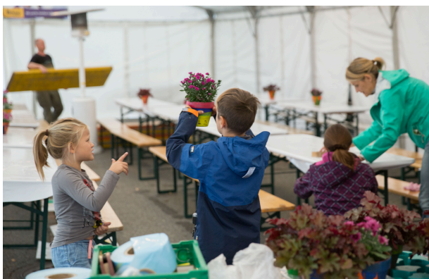
Alle helfen mit – von Gross bis Klein beim Aufbau!

Im September war die Dorfchilbi wiederum das Dorfereignis des Jahres, und die Zeltattraktionen des Elternvereins Illnau sorgten zwei Tage für gute Laune – trotz den nicht optimalen Wetterverhältnissen. Abends war es ungewöhnlich kalt und die Caipibar wäre wohl besser mit Punsch ausgestattet gewesen! Nichtsdestotrotz, die Stimmung am Freitag wie auch am Samstag beim Konzert von Fine-Taste war riesig.