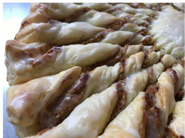
Die Illauer Sonne – ein Rezept aus unserem Kochbuch zum 25 Jahre Jubiläum des Elternvereins Illnau, hier beim Rezept-Nachkochen – ob's gelingt?