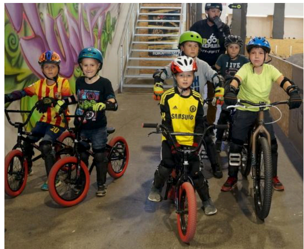
Frühlingsplausch im Indoorpark Pfäffikon