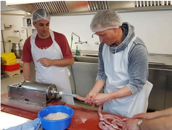
Handwerkliches Geschick ist gefragt