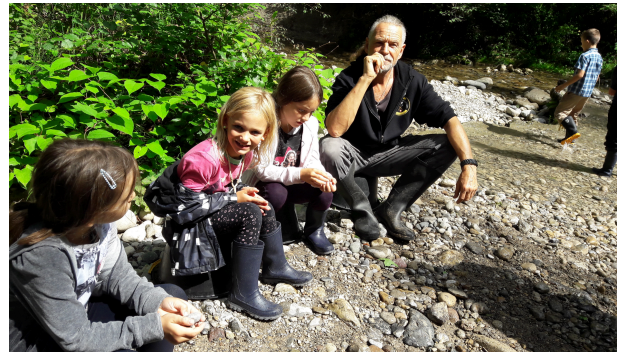
Eine kurze Pause sei ihnen gegönnt! – Goldwaschen 2017

Goldwaschen in der vierten Ferienwocher mit hohem Spassfaktor in der Natur, im Kemptner Tobel!