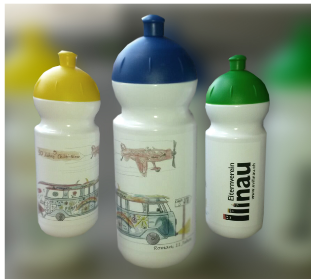
Die Trinkflasche ist ein Hit!