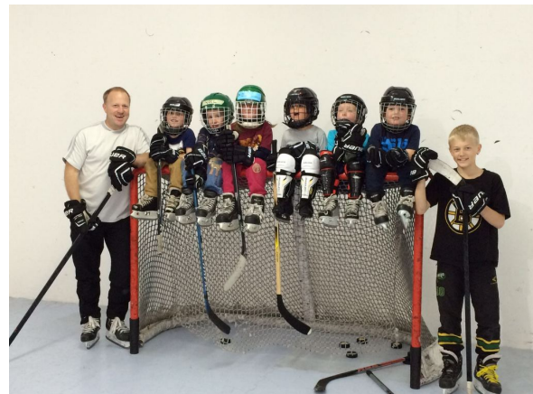
Eishockey im Wohnzimmer

Der Frühlingsplausch begeisterte auch dieses Jahr wieder über 100 Kinderherzen, mit bewährten und vielen rasch ausgebuchten Anlässen wie Feuerwehr und Backen in der Backstube. Neu wurde mit Erfolg Elefanten-Morgenessen im Kinderzoo, „Eishockey im Wohnzimmer“ und Meerjungfauenschwimmen angeboten.