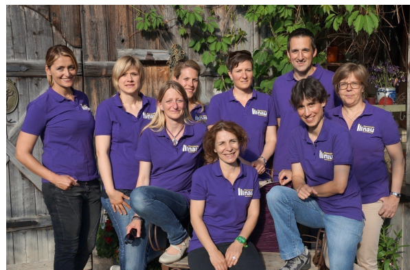
„Am Charrewäg“ das Vorstandessen genossen.

Insgesamt kam der Vorstand sechsmal zusammen. Während den abendfüllenden Sitzungen wurde aktiv, mit Elan und Freude diskutiert. Die Präsenzzeit an den verschiedenen Veranstaltungen eingerechnet, wurden im Jahr 2016 vom Vorstand 1000 Stunden Freiwilligenarbeit für den Elternverein Illnau geleistet.