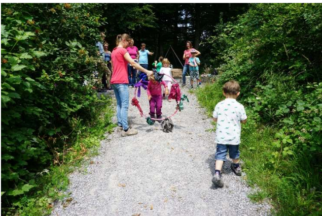
Abschlussmorgen in der Waldspielgruppe

Waldspielgruppe freitags von 8:30-11:30 Uhr, weitere Info unter http://www.evillnau.ch/Angebot/Waldspielgruppe