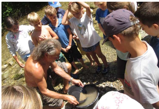
Die Goldpfanne wird gewaschen

Das Goldwaschen fand in der vierten Ferienwoche mit hohem Spassfaktor in der Natur, im Kemptner Tobel statt!