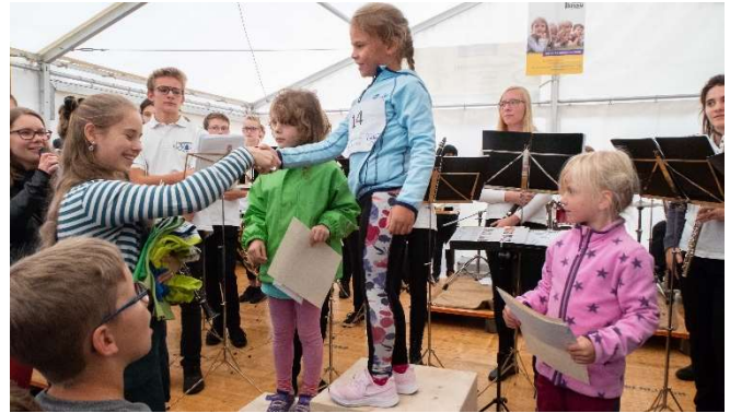
Unsere jüngsten Siegerinnen

Am Sonntagnachmittag fand zum zweiten Mal die Rangverkündigung des „Gschnällschten Illauers“ im EVI-Zelt statt. Die Stadtjugendmusik Illnau-Effretikon spielte ein Kurzkonzert zur Einstimmung und untermalten die Siegerplätze zusätzlich durch einen Tusch. Wir gratulieren an dieser Stelle nochmal ganz herzlich allen Gewinnerinnen und Gewinnern in diesem Jahr.