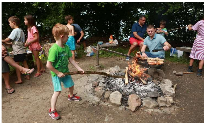
Gemeinsames Grillieren an der grossen Feuerstelle

Aufgrund des guten Feedbacks vom Vorjahr haben wir auch dieses Jahr wieder die Jugendherberge Fällanden am Wochenende vom 15./16. Juni für das Vater und Kinder-Wochenende gebucht. Einen Tag und eine Nacht nur mit dem Papi - und vielen Freunden! Das war cool! Es war auch dieses Jahr wieder sehr aussergewöhnlich und einzigartig. Da konnten sich die Kinder am Greifensee abkühlen, mit dem Böötti fahren, mit dem Papi Fussballspielen oder herumbalgen. So gut hat es den Kindern und Vätern auch im 2019 gefallen, dass wir gleich für das übernächste Jahr das Haus wieder ein Wochenende im Juni 2021 reserviert haben (für 2020 war die Jugi leider bereits komplett ausgebucht!! Also unbedingt das Datum im 2021 reservieren, es ist wirklich etwas Einzigartiges)!