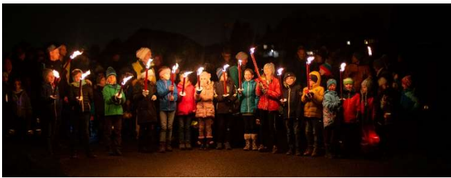
Aufeinandertreffen der zwei Züge

Unser Räbeliechtliumzug in Illnau ist übrigens einer der grösseren dieser Art in der Region mit über 500 Teilnehmern . Darauf sind wir sehr stolz! Wir möchten uns an dieser Stelle bei allen Organisatoren und Unterstützern recht herzlich bedanken. Nur durch eure Mithilfe ist es uns Jahr für Jahr möglich, diesen traditionellen Anlass durchzuführen.