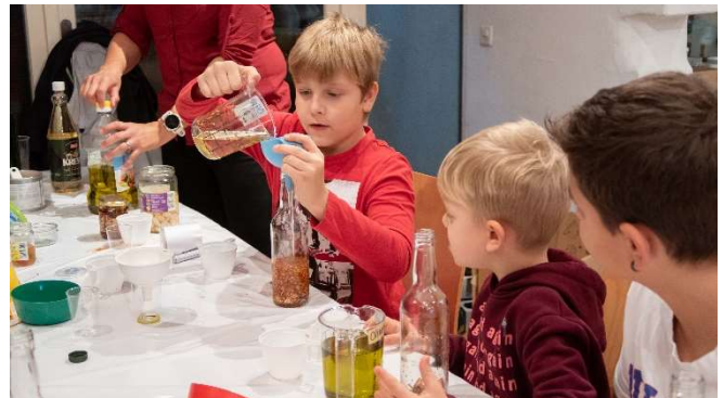
Es werden Pizzaöle selber gemacht

Bereits zum vierten Mal und wiederum mit viel Engagement haben wir dieses Jahr die Weihnachtswerkstatt am 16.11.19 durchgeführt. Es wurde fleissig gemalt, geklebt, geschnitten. Die Auswahl war wieder einmal gross – und am Ende waren fast alle Geschenke ausverkauft!