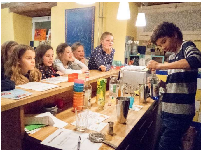
Mocktailbar am Funkykino-Abend

Der Frühlingsplausch 2019 begeisterte auch dieses Jahr wieder zahlreiche Kinderherzen, mit bewährten und immer wieder ausgebuchten Anlässen. Auch einige neue Angebote wurden ins Programm