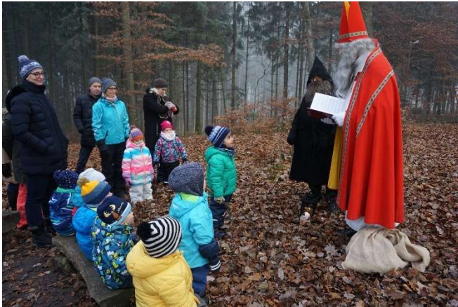
Der Samichlaus ist zu Besuch in der Waldspielgruppe

Allen Leiterinnen von Chinderhüeti, Spielgruppen und Chrabbelgruppe ein herzliches Dankeschön für das Engagement und die tolle Zusammenarbeit! Schön, dass es im Purzelhuus so viel Leben gibt und mit viel Elan und guter Stimmung gearbeitet wird! Ebenso freut es uns sehr, dass es auch eine Waldspielgruppe für die Illauer Kinder gibt. Dankeschön!