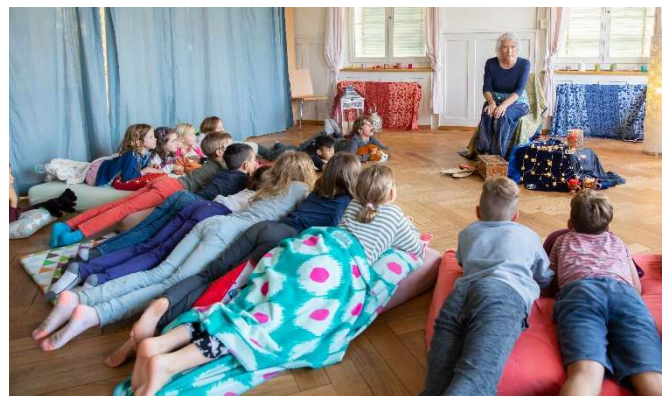
Gespanntes Zuhören bei der Erzählnacht

Die Erzählnacht im Purzelhuus in Zusammenarbeit mit der Bibliothek Illnau kurz vor den Herbstferien war dem Thema «Orient und 1001 Nacht gewidmet . Wir freuten uns sehr, dass wir wie im Vorjahr ca. 60 Kinder für diesen Anlass begeistern konnten.