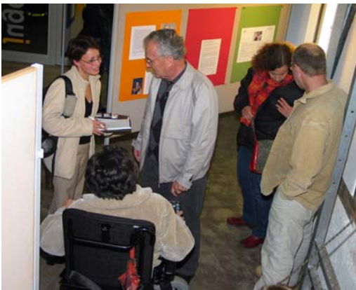
So gseh ich Dich Grossmami / Grosspapi und so bisch Du junge Enkel! Portraits sind im Internet www.evillnau.ch