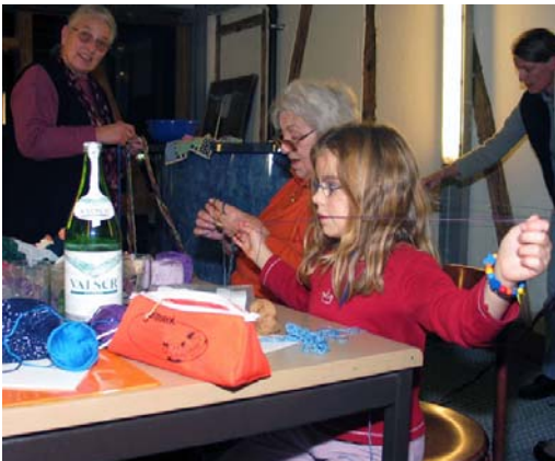
Wie lang mues die Schnuer wärde? Aha bis zum Altersheim übere – so lang!