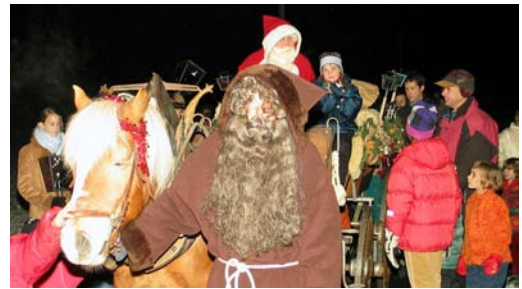
De Joggeli zieht em Chlaus sin Wage.