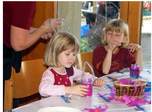
Mir mached da immer öpis für s'Grosi!