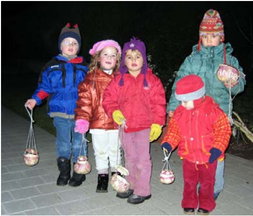
Die Lämpli hämer sälber gschnitzt!