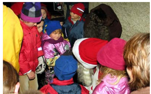
„Jetzt säg ich Dir was Du alles Guets gmacht häsch!“