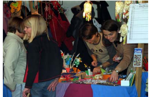
Chlini Sache zu chline Pris am Chinderstand.